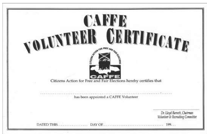
FIGURA 4-2: CERTIFICADO DE RECONOCIMIENTO PARA UN OBSERVADOR ELECTORAL VOLUNTARIO

Un mensaje de reclutamiento eficaz motiva a los voluntarios desde el principio. De hecho, la experiencia en todo el mundo muestra que una vez que los voluntarios comprenden cómo funciona un conteo rápido y por qué es importante, ellos expresan su gratitud por tener la oportunidad de hacer algo concreto para promover o fortalecer la democracia en su país. Su entusiasmo mientras leen y firman los juramentos de imparcialidad es palpable y su motivación es fuente de inspiración.