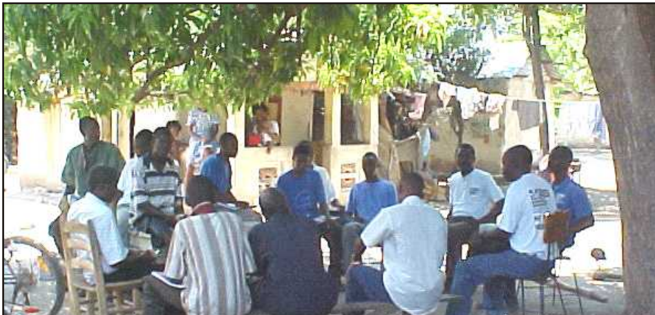
Une session du Forum Civique à Thomazeau

Pour aller à Thomazeau, vous avez deux possibilités : où vous longez la route menant vers Malpasse, et arrivé à Beaugé, localité de Ganthier, vous tournez à gauche, au carrefour Beaugé 3, vous traverserez les localités de Bois Léger et de Merceron ; continuez, vous arriverez à Thomazeau. Vous pouvez aussi à partir de Croix des Bouquets prendre la Route Nationale 3, et au bas du morne à cabrits, vous tournez à droite au carrefour Thomazeau. Vous traverserez la localité de Trou Caïman où vous aurez l'occasion d'admirer les rives de l'étang. Quelques minutes après vous serez à Thomazeau.