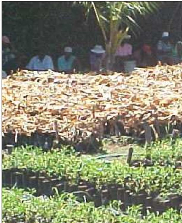
Des membres du comité d'initiatives de Monséjour préparent les arbustes devant servir au projet reboisement de la localité.

A Monséjour des citoyens ont décidé de réagir correctement, de prendre l'initiative et de mettre la main à la pâte pour se construire un meilleur avenir.