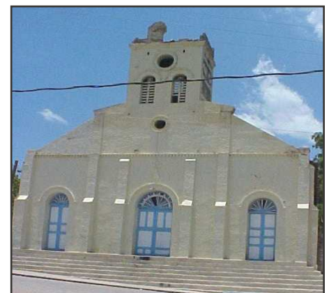
La Cathédrale de Thomazeau

Les amateurs de tourisme local peuvent désormais inscrire une nouvelle destination sur leur carnet de route: THOMAZEAU . La route n'est pas en trop mauvais état; allez-y, la commune vous étonnera.