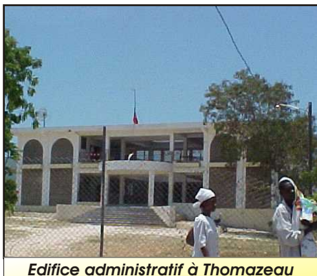
Edifice administratif à Thomazeau

Pour aller à Thomazeau, vous avez deux possibilités : où vous longez la route menant vers Malpasse, et arrivé à Beaugé, localité de Ganthier, vous tournez à gauche, au carrefour Beaugé 3, vous traverserez les localités de Bois Léger et de Merceron ; continuez, vous arriverez à Thomazeau. Vous pouvez aussi à partir de Croix des Bouquets prendre la Route Nationale 3, et au bas du morne à cabrits, vous tournez à droite au carrefour Thomazeau. Vous traverserez la localité de Trou Caïman où vous aurez l'occasion d'admirer les rives de l'étang. Quelques minutes après vous serez à Thomazeau.