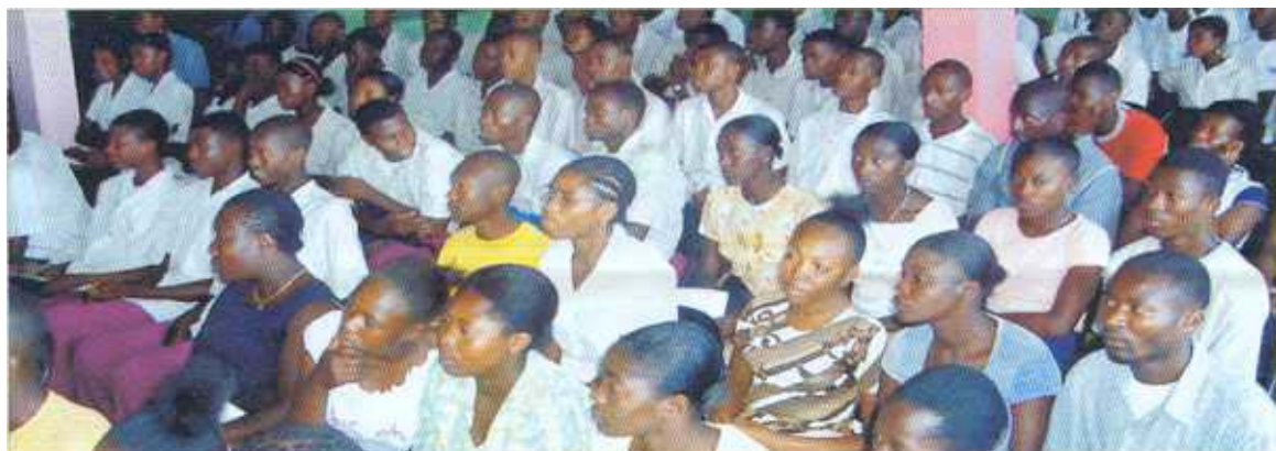
Yon foul elèv, pwofesè ak paran ki te asiste nan seremoni a.