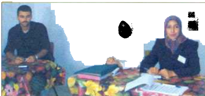
Yon biwo anrejistreman elektè nan Bethlehem, an Palestin.