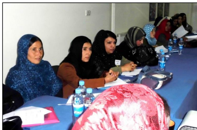
په کابل کې د ملي ډیموکراټیک انسټیټیوټ په دفتر کې د ولایتي شوراگانو ښځینه نوماندې د ناستې پر مهال

د ۲۰۱۲ کال د ټاکنو د خپلواک کمېسیون او د ټاکنیزو شکایتونو د خپلواک کمېسیون د جوړښت د قانون پر بنسټ، د ټاکنو د خپلواک کمېسیون د ۹ تنو کمیشنرانو څخه له ډلې څخه ۲ تنه او ټاکنیزو