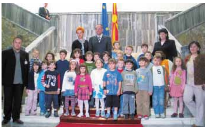
Македония: Дни открытых дверей для молодежи

Во многих странах парламент сделал дополнительный шаг в создании не только открытого и публичного процесса того, как они функционируют, но и также в открытии дверей непосредственно общественности. В некоторых странах есть несколько дней в году, когда весь парламент открыт для всех, и люди могут ходить по залам, сидеть за столами комитетов, и получать опыт парламента. Это лучше, чем стандартный тур. В Македонии, например, парламент открыл себя детям страны, привозя на автобусах школьников в парламентский комплекс на день для изучения парламента, как он работает, и что парламентарии могут сделать для них.