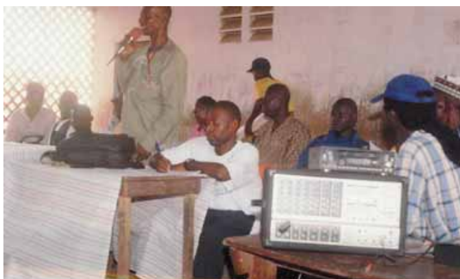
Сьерра-Леоне: охватывая более широкие круги населения через радио

Хорошие стратегии коммуникаций используются множество методов, и радио – одно из полезных средств, которые нужно включить, когда законодателю необходимо расширить его или её аудиторию. В Сьерра-Леоне законодатели совместили общественное собрание с радиопередачей, чтобы охватить как можно больше избирателей. Во время форума они пригласили местную радиостанцию для освещения происходящего. После форума они провели полуторачасовую передачу со звонками в прямой эфир, во время которой отвечали на вопросы от избирателей, не сумевших посетить общественный форум. Такие радиопередачи стали популярны и позволили законодателям донести свои сообщения и вовлечь куда большую аудиторию, чем если бы они просто провели общественный форум.