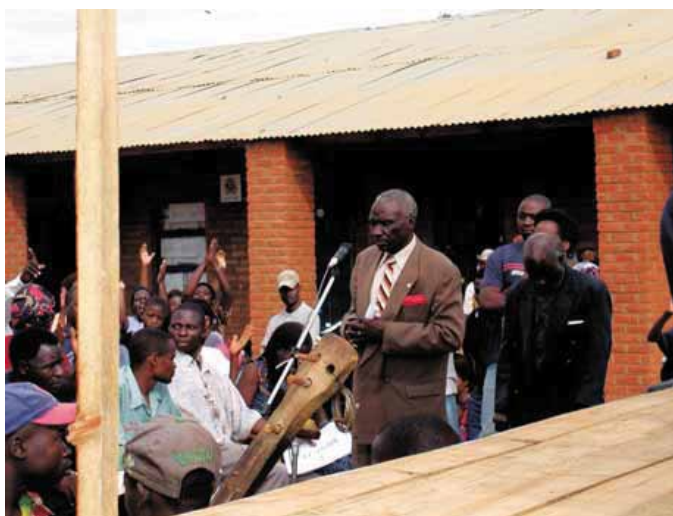
Малави: Проводя «Дни общественных встреч»

В Малави один депутат проводит «Дни общественных встреч» восемь раз в год в разных местах в своем округе. Депутат приглашает традиционных лидеров, религиозных лидеров и простую публику на традиционные танцы, футбол и неформальные общественные встречи. Это позволяет депутату встречаться со своими избирателями в веселой, свободной атмосфере, и в то же время услышать от людей про их проблемы и поддерживать контакты с важными местными лидерами.