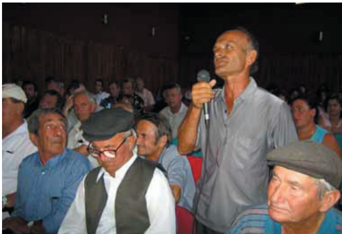
Албания: Устанавливая контакты через общественные форумы

В Албании депутаты используют общественные форумы для ведения диалогов с гражданами по широкому кругу вопросов. На этой фотографии граждане албанского города Новосела задают вопросы о бюджетных приоритетах у своего избранного представителя на общественной встрече.