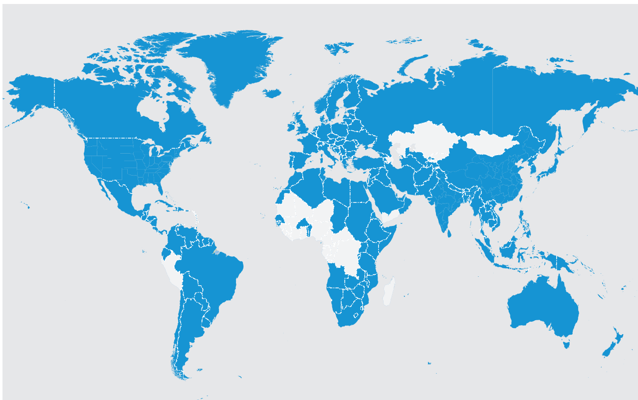
Gambar 1. Negara-Negara Kandidat EITI per Januari 2009