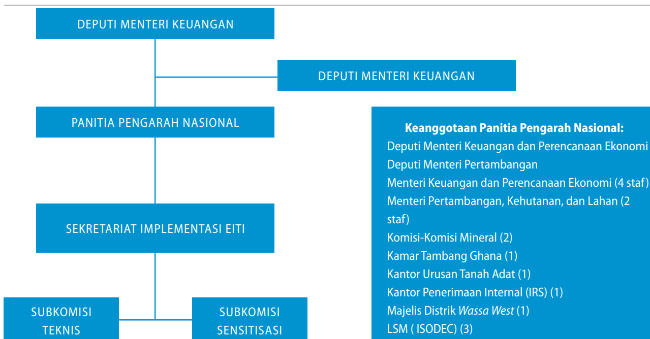
Diagram 2 : Struktur Tatakelola EITI Ghana

Masyarakat sipil dan dunia usaha juga telah membentuk kelompok-kelompok konstituensi, yang memiliki wakil-wakil yang duduk di MSG. Mereka bertemu untuk membahas keputusan-keputusan EITI dan wakil-wakil mereka berbagi pandangan kelompok tersebut dalam MSG.