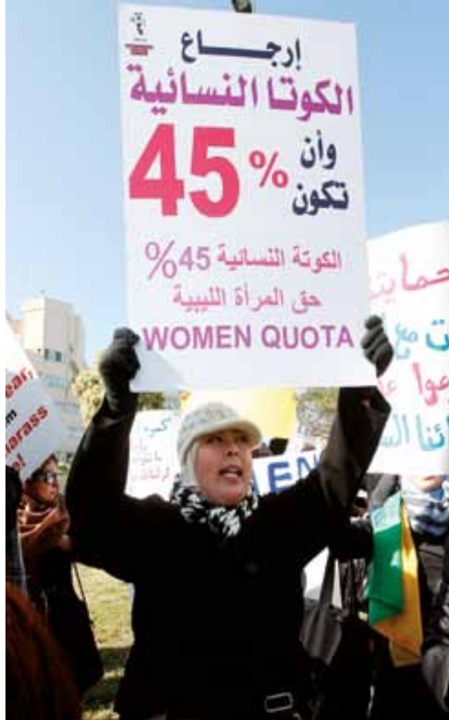
▲ Libia, 2012.

A pesar de los llamamientos en favor de la reforma y el cambio político y democráticos en Egipto, este país árabe ha registrado un descenso del número de parlamentarias por segundo año consecutivo. En 2011, en las elecciones para la cámara baja resultaron elegidas menos de un 2% de parlamentarias, frente al 12,7% anterior. Asimismo, en las elecciones de principios de 2012 a la cámara alta, el Consejo de la Shura, también resultaron elegidas menos mujeres, sólo 12 (4,4%). La representación parlamentaria de las mujeres en Egipto ha caído al nivel más bajo