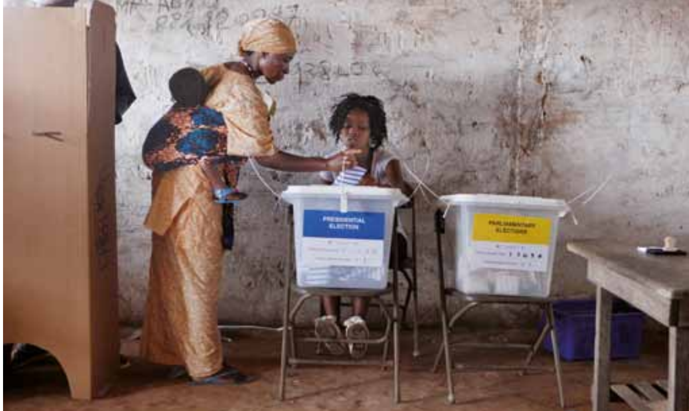
▲ Sierra Leona, 2012.